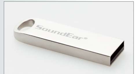
USB-Stick zum Auslesen der Daten