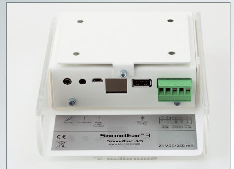
SoundEar®3 – Anschlusspanel